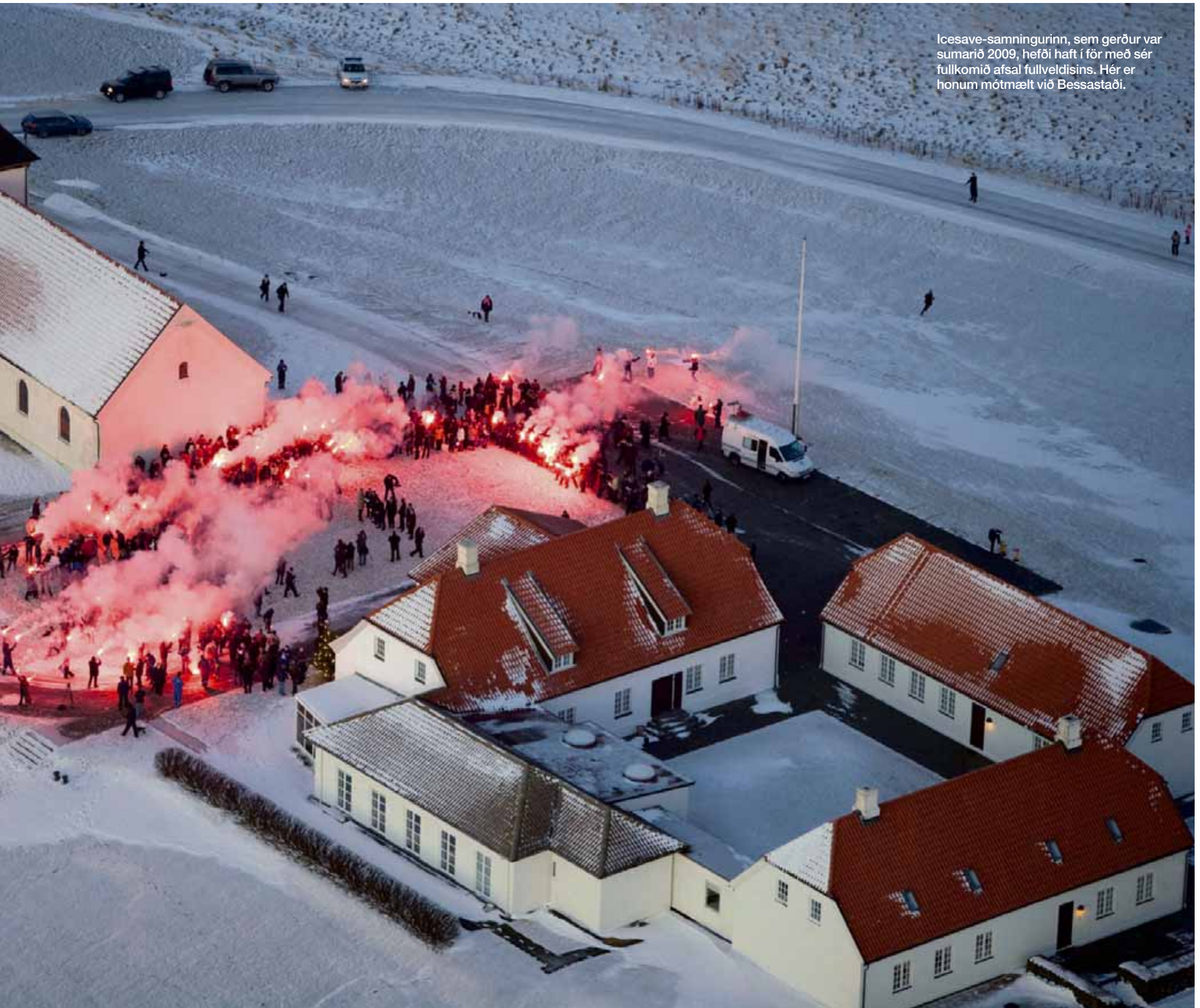
Icesave-samningurinn, sem gerður var sumarið 2009, hefði haft í för með sér fullkomið afsal fullveldisins. Hér er honum mótmælt við Bessastaði.